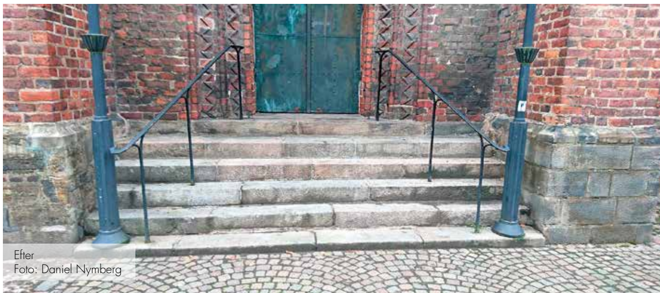
Efter Foto: Daniel Nymberg