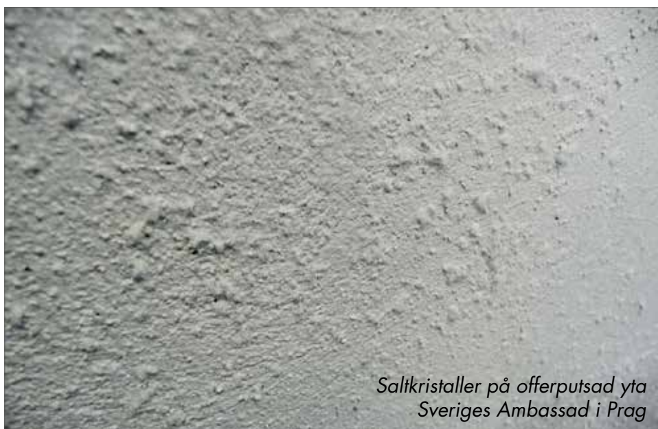
Saltkristaller på offerputsad yta Sveriges Ambassad i Prag